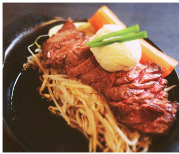
うえずたんサガリ

80g ¥1,490 100g ¥1,590 150g ¥2,090 200g ¥2,590