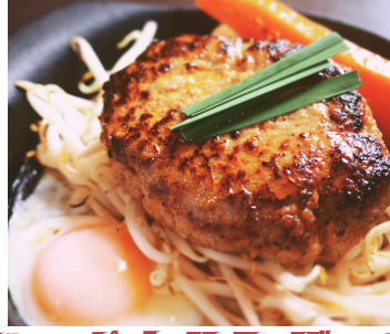
ジャポネハンバーグ