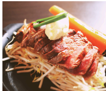
ニューヨークカインミ