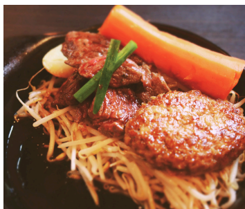
サイコロ&ハンバーグ