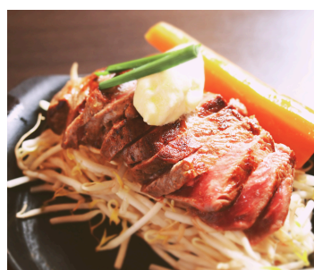
ニューヨークガインミ