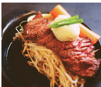
うえずたんサガリ

80g ¥1,490 100g ¥1,590 150g ¥2,090 200g ¥2,590