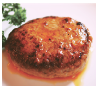
自家製ハンバーグ