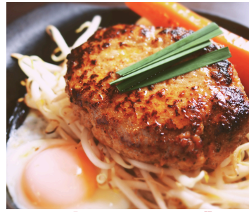
ジャポネハンバーグ