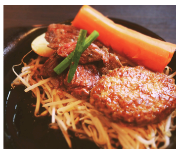
サイコロ&ハンバーグ