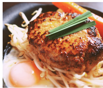
ジャポネハンバーグ