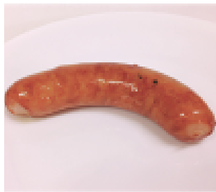
手造りウィンナー