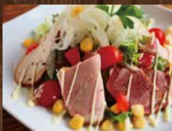
自家製ハムのサラダ ¥890