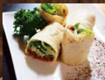
うえずたんタコス ¥860