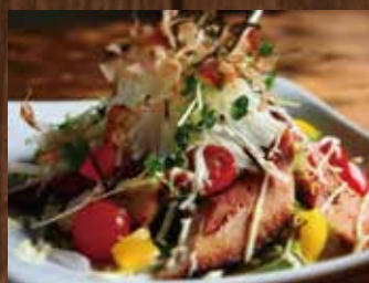
自家製ベーコンと大根のサラダ ¥990