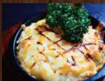
ポテトベーコンチーズ ¥690