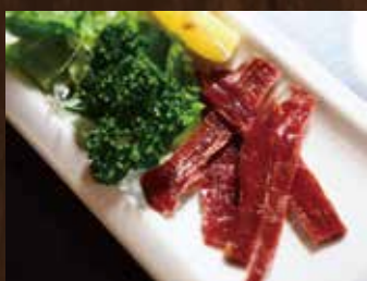
自家製ビーフジャーキー ¥530