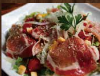
自家製生ハムのシーザーサラダ ¥1,090