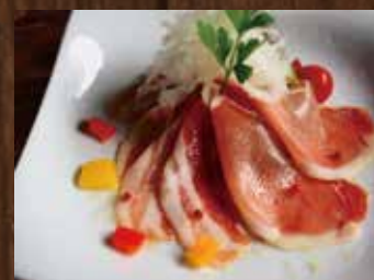
自家製生ハムと生ベーコン ¥900