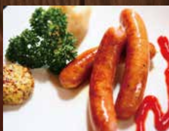
自家製ソーセージコンボ ¥780