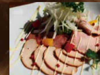
自家製ハムの3点盛り ¥790