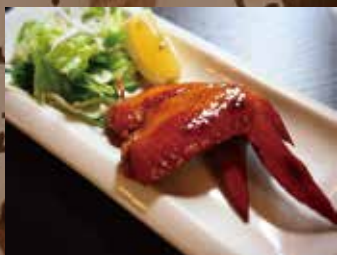
手羽先の燻製 (2本) ¥380