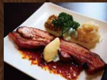
手作りベーコンの炙り ¥860