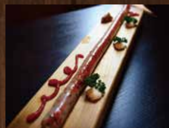
鶯与丁ソーセージ (約 42cm) ¥1,090