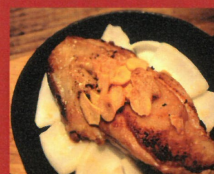
チキンステーキ 100g ¥450