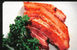
手造りベーコン 50g 300円