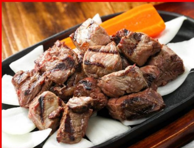
Sirloin dice Steak