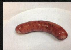
自家製ウィンナー 1本160円