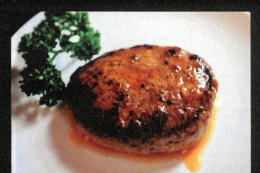
自家製ハンバーグ 100g 500円