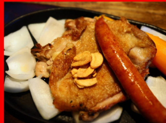
Chicken steak & Sausage