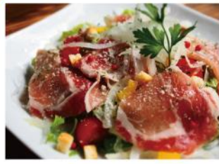
生ハムシーザーサラダ ¥990