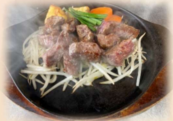
サイコロステーキ 150g