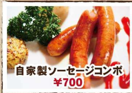
自家製ソーセージコンボ ¥700