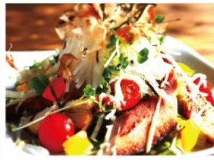
ベーコンと大根のサラダ ¥860