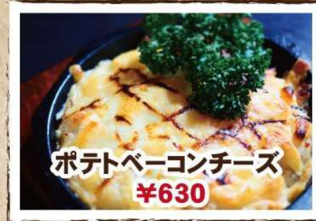
ポテトベーコンチーズ ¥630