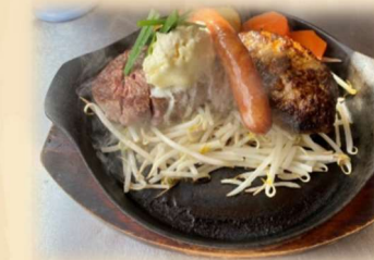
E ヒレステーキ&ハンバーグ &ソーセージ