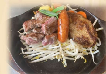
B サイコロ&ハンバーグ &ソーセージ