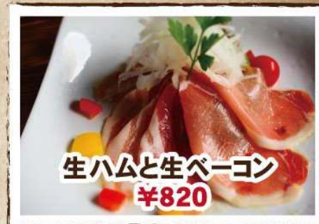
生ハムと生ベーコン ¥820