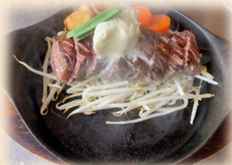
ビフテキうえすたん 150g (サガリステーキ)