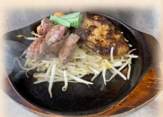
A サイコロ&ハンバーグ