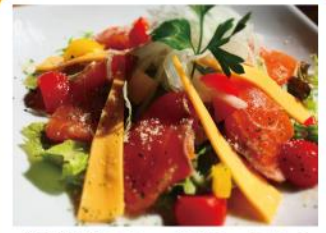
自家製スモークサーモンとチーズのサラダ ¥990