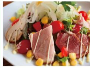
手造りハムのサラダ ¥790