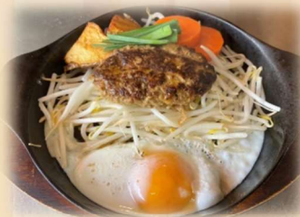
ハンバーグステーキ 100g