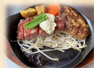
C サーロイン&ハンバーグ