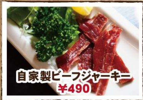
自家製ビーフジャーキー ¥490