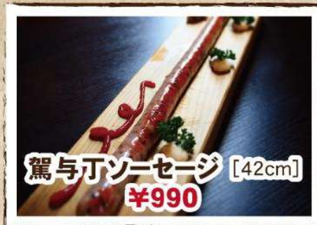
駕与丁ソーセージ [42cm] ¥990