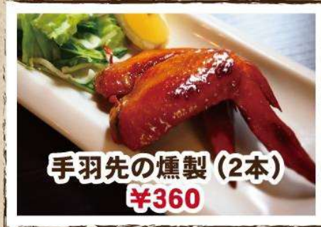
手羽先の燻製 (2本) ¥360