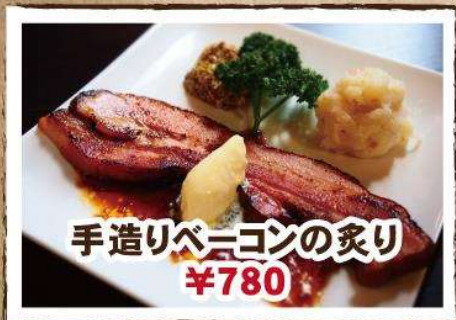
手造りベーコンの炙り ¥780