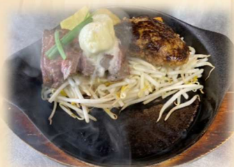
D ヒレステーキ&ハンバーグ