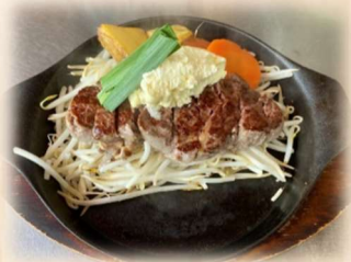
サーロインステーキ 150g