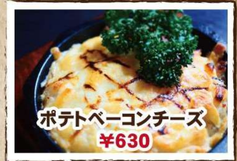
ポテトベーコンチーズ ¥630