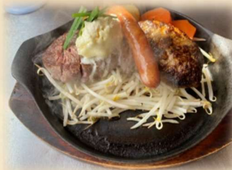
E ヒレステーキ&ハンバーグ &ソーセージ