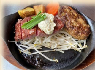
C サーロイン&ハンバーグ