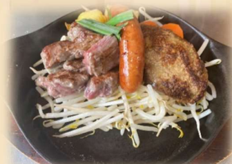
B サイコロ&ハンバーグ &ソーセージ