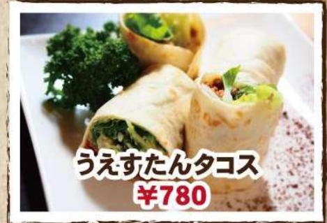
うえすたんタコス ¥780