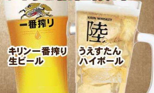
麒麟一番搾り キリン一番搾り 生ビール