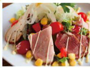
手造りハムのサラダ ¥790