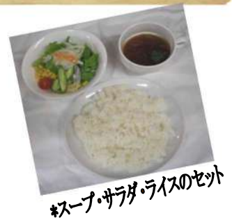
*スープ・サラダ・ライスのセット