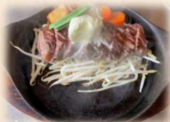
ビフテキラースたん 150g (サガリステーキ)