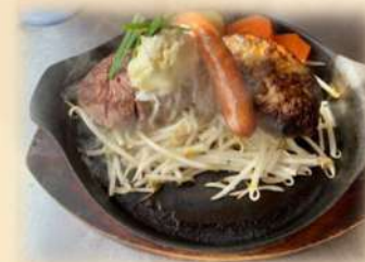
E ヒレステーキ&ハンバーグ &ソーセージ