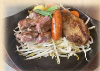
B サイコロ&ハンバーグ &ソーセージ