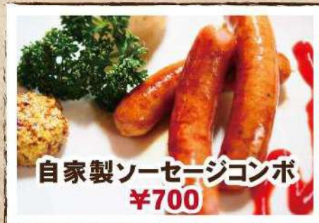
自家製ソーセージコンボ ¥700