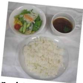
*スープ・サラダ・ライスのセット