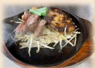
A サイコロ&ハンバーグ