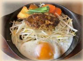
ハンバーグステーキ 100g