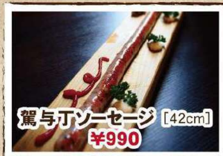
駕与丁ソーセージ [42cm] ¥990