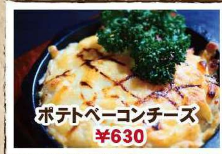
ポテトベーコンチーズ ¥630