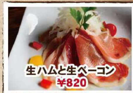
生ハムと生ベーコン ¥820