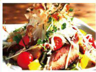
ベーコンと 大根のサラダ ¥860