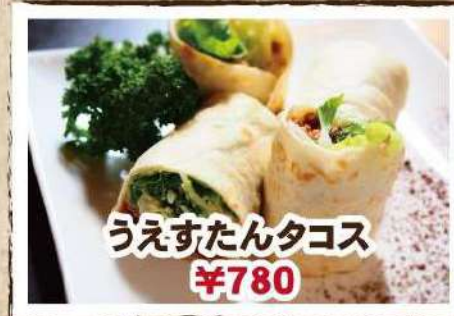
うえすたんタコス ¥780