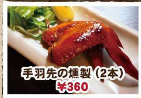
手羽先の燻製 (2本) ¥360