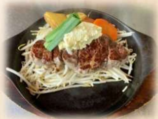
サーロインステーキ 150g