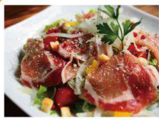
生ハムシーザーサラダ ¥990