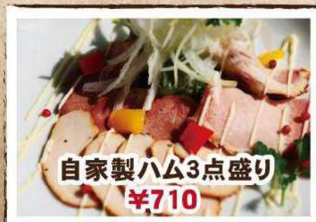
自家製ハム3点盛り ¥710