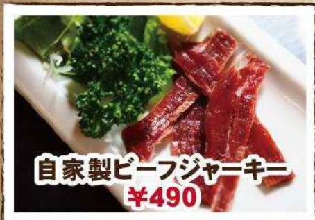
自家製ビーフジャーキー ¥490