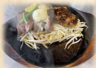
D ヒレステーキ&ハンバーグ