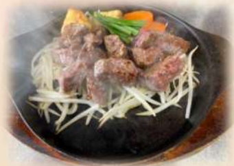
サイコロステーキ 150g