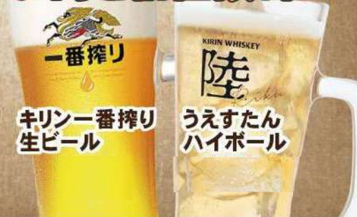
キリン一番搾り 生ビール