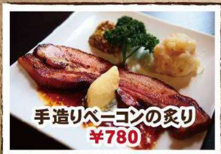
手造りベーコンの炙り ¥780