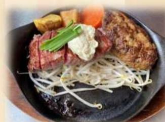
C サーロイン&ハンバーグ