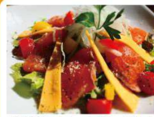
自家製スモークサーモンと チーズのサラダ ¥990