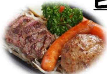
(写真はウィンナー付コンボです。)