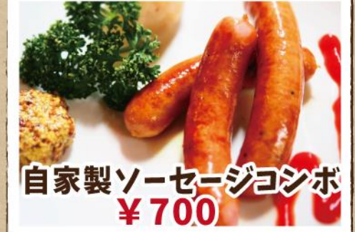
自家製ソーセージコンボ ¥700