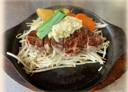
サーロインステーキ 150g