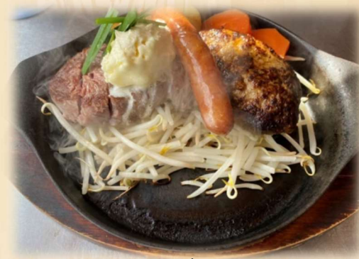
E ヒレステーキ&ハンバーグ &ソーセージ