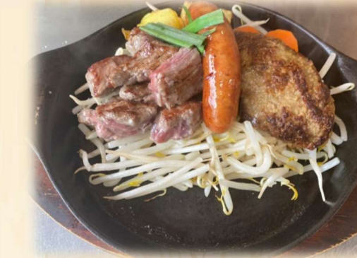
B サイコロ&ハンバーグ &ソーセージ