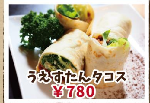
うえすたんタコス ¥780