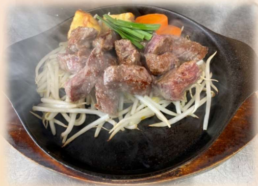
サイコロステーキ 150g