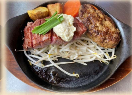
C サーロイン&ハンバーグ