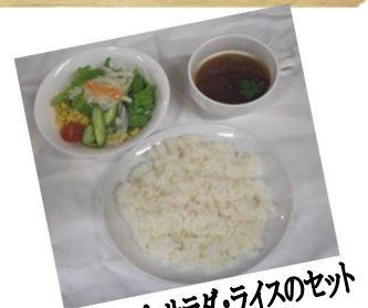
*スープ・サラダ・ライスのセット