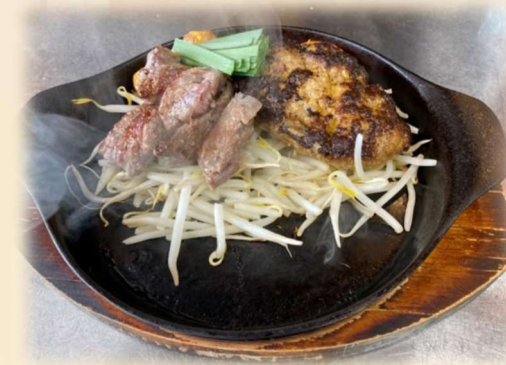
A サイコロ&ハンバーグ