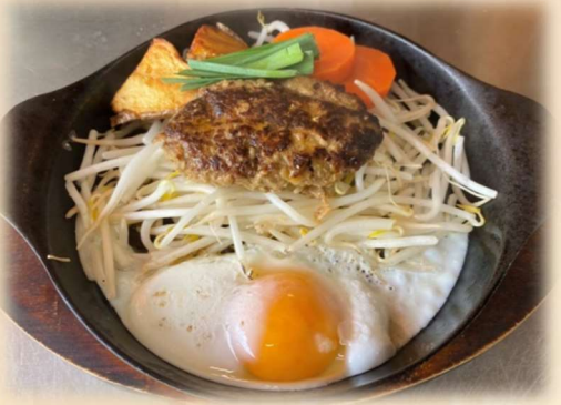
ハンバーグステーキ 100g