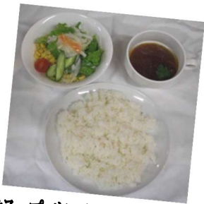
*スープ・サラダ・ライスのセット