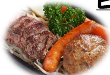
(写真はウィンナー付コンボです。)