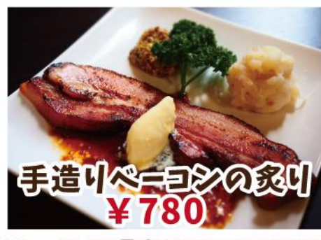
手造りベーコンの炙り ¥780