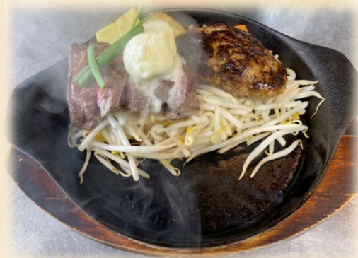
D ヒレステーキ&ハンバーグ