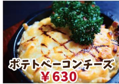
ポテトベーコンチーズ ¥630