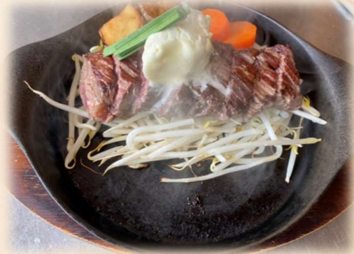
ビフテキろえたん 150g (サガリステーキ)