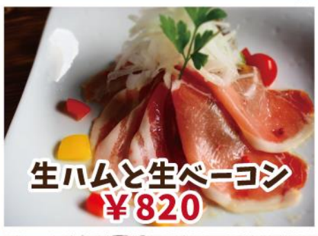
生ハムと生ベーコン ¥820